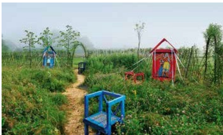
Ryc. 45. II Festiwal Ogrodowy. Ogród pokazowy. Od powietrza, ognia, głodu i wojny..., 2012