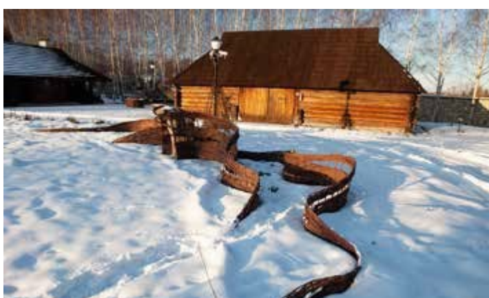
Ryc. 52. Zabytkowa stodoła z Cieszanowa, 2012, fot. N. Piórecki

Zgromadzono również kolekcję ziół, których rozcierane liście dostarczają wrażeń zmysłowych. Ogród jest obiektem uniwersalnym, gdyż umożliwia prowadzenie stałych zajęć edukacyjnych zarówno dla osób niepełnosprawnych, jak również dla wszystkich osób odwiedzających Arboretum. Ze względu na duże nagromadzenie wielu gatunków roślin na niewielkiej powierzchni, może być traktowany jako samodzielny, równoprawny ogród o dużych możliwościach poznawczych i edukacyjnych. Ponadto ogród zaprojektowano w ten sposób, aby służył jako otwarta sala koncertowa.