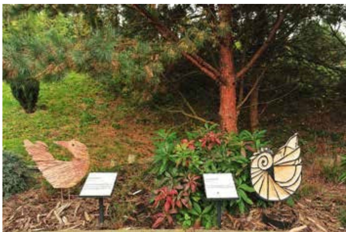
Ryc. 51. Sensualny Ogród Uniwersalny – Galeria przez Dotyk, 2012