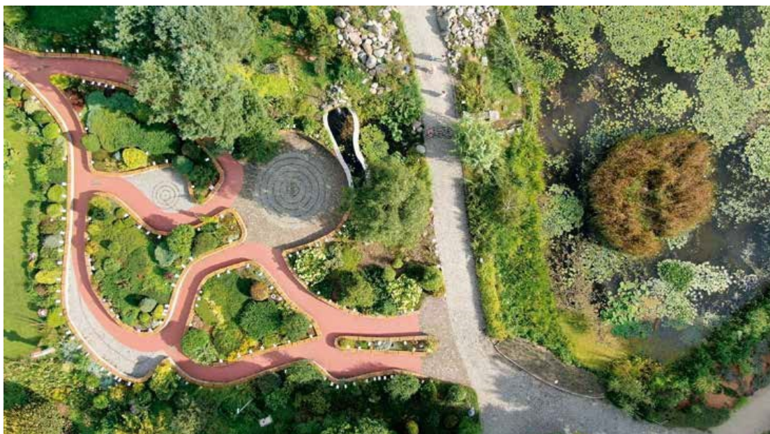
Ryc. 49. Sensualny Ogród Uniwersalny – widok z lotu ptaka, 2020, fot. Ł. Malicki