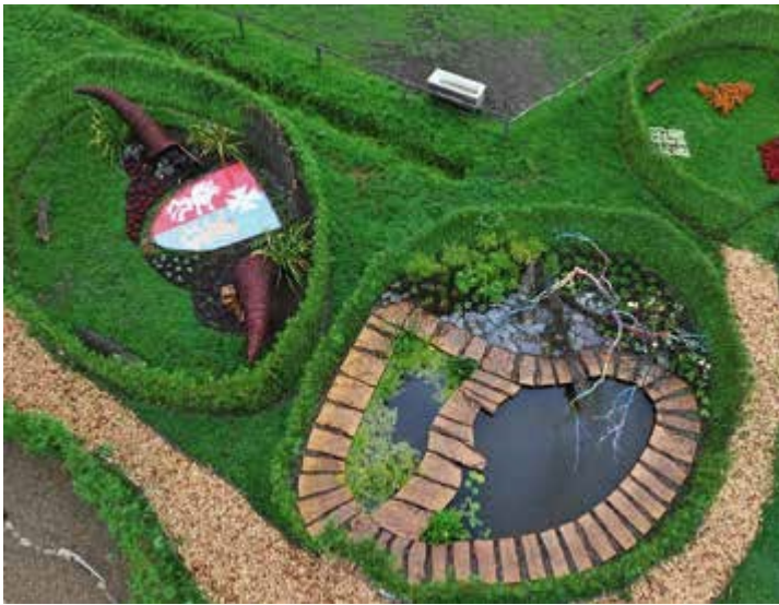
Ryc. 43. II Festiwal Ogrodowy – ogrody pokazowe, 2012

oraz instalacje przestrzenne Malarstwo Przestrzeni przygotowane przez studentów Architektury Wnętrz Akademii Sztuk Pięknych w Łodzi (Ryc. 47).