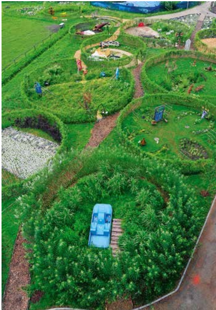
Ryc. 47. Ogrody pokazowe zaprezentowane w ramach II Festiwalu Ogrodowego – widok z lotu ptaka, 2012

przestrzeni ogrodowych. W ramach Festiwalu Wojciech Januszczyk z Katolickiego Uniwersytetu Lubelskiego w Lublinie zaprezentował cykl ogrodów Protest Garden.