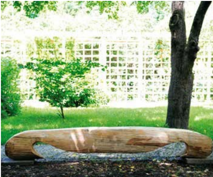
Ryc. 48. Ogród strefą dizajnu – ławka, praca Piotra Szwieca, 2015

we współpracy z artystycznymi uczelniami wyższymi z Polski z Krakowa, Łodzi, Poznania i zagranicy: Litwy z Wilna i Ukrainy ze Lwowa. Działania artystyczne przeprowadzone w przestrzeni Arboretum związane były z szeroko rozumianym dizajnem, tak ważnym w przestrzeni ogrodu. Celem warsztatów było podniesienie poziomu edukacji artystycznej studentów uczelni artystycznych, przez realizację interdyscyplinarnych zadań z użyciem biodegradowalnych materiałów. Wykonane przez uczestników prace zaprezentowane zostały w przestrzeni ogrodu. Opiekę merytoryczną nad zadaniem sprawował koordynator zadania dyrektor Arboretum dr Narcyz Piórecki. Warsztaty prowadzili profesorowie: koordynator zadania Marek Sak (Akademia Sztuk Pięknych w Łodzi), Lilla Kulka (Akademia Sztuk Pięknych w Krakowie), Živilė Jasutytė (Akademia Sztuk Pięknych w Wilnie), Piotr Szwiec (Uniwersytet Artystyczny w Poznaniu), Oleksandr Honcharuk (Akademia Sztuk Pięknych we Lwowie).