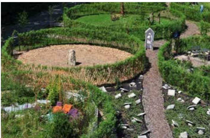
Ryc. 44. Ogrody pokazowe zaprezentowane w ramach II Festiwalu Ogrodowego.

III Festiwal Ogrodowy odbył się w 2013 r. Był to pierwszy festiwal z motywem przewodnim – pop art. W tej edycji Festiwalu zaprezentowano 21 ogrodów. W czasie festiwalu w ogrodzie Kalwaria miała miejsce akcja artystyczna zatytułowana Weeding art, czyli sztuka pielenia, mająca na celu zwrócenie uwagi na konieczność ciągłej pracy nad ogrodem. Festiwalowi towarzyszyła konferencja naukowa na temat idei ogrodów pokazowych (Ryc. 46).