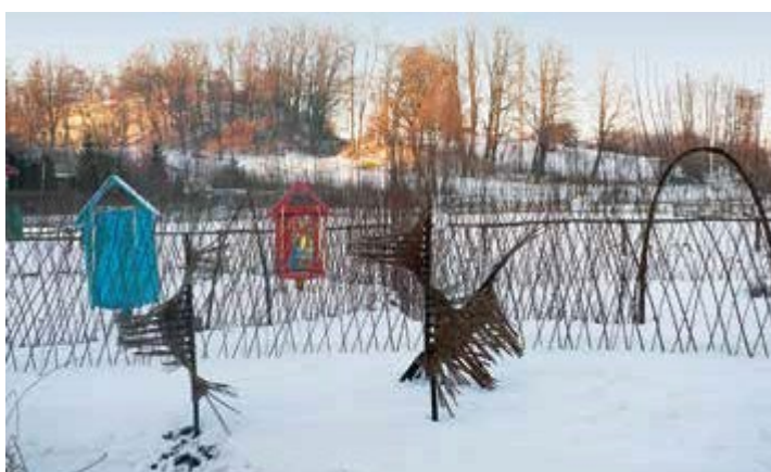
Ryc. 46. II Festiwal Ogrodowy – ogrody pokazowe w zimowej szacie, 2012

W kolejnych edycjach Festiwalu IV (2014) i V (2015) powstawały kolejne ogrody i instalacje przestrzenne. W czasie VI (2016) i VII (2017) edycji Festiwalu zaprezentowano aż 30 ogrodów, tak jak w poprzednich latach, część nowych, a część udoskonalonych, uaktualnionych. VIII edycja została odwołana ze względu na inwestycje budowlane prowadzone na terenie Arboretum. W czasie IX (2019) edycji festiwalu zaprezentowano w sumie 20 ogrodów pokazowych, w tym 6 zupełnie nowych. Podobnie jak w latach ubiegłych przeprowadzono prace pielęgnacyjne i nasadzenia w ogrodach powstałych podczas wcześniejszych festiwali. Ostatni X (2020) Festiwal Ogrodowy odbył się w znacznie okrojonej formie z powodu sytuacji epidemiologicznej, zaprezentowano 22 ogrody, w tym 2 nowe. Festiwal Ogrodów jest jedynym tego typu cyklicznym wydarzeniem w Polsce, prezentującym najnowsze działania z pogranicza sztuki i projektowania nowatorskich