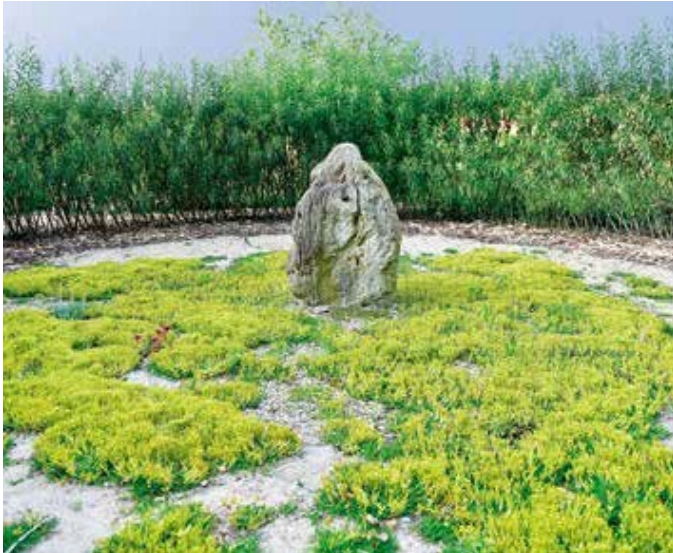
Ryc. 119. Marek Sak. Ogród I, 2016