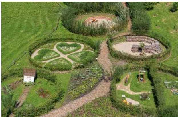
Ryc. 107. Festiwal Ogrodowy – widok z lotu ptaka od strony północnej, 2013, fot. N.

Ogród?... Dziwny?... Jacek Szwiec. Wystawa towarzysząca IV Festiwalowi Ogrodowemu.