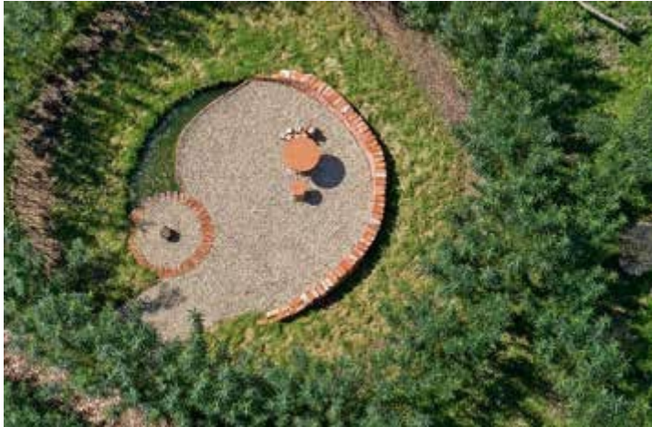
Ryc. 115. Witold Mityk. Chciwość, 2015, fot. Arboretum Bolestraszyce