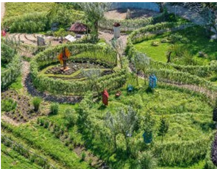
Ryc. 111. Festiwal Ogrodowy – fragment ogrodów pokazowych, 2014

Wystawa towarzysząca V Festiwalowi Ogrodowemu – Notatki do marzeń... Niech się stanie... Lilla Kulka.