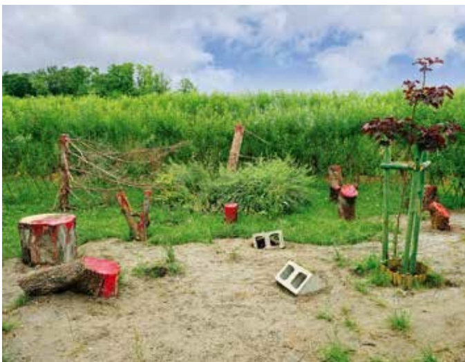
Ryc. 120. Wojciech Januszcyk. Protest Garden III ----Nasadzenia Przystępcze, 2016