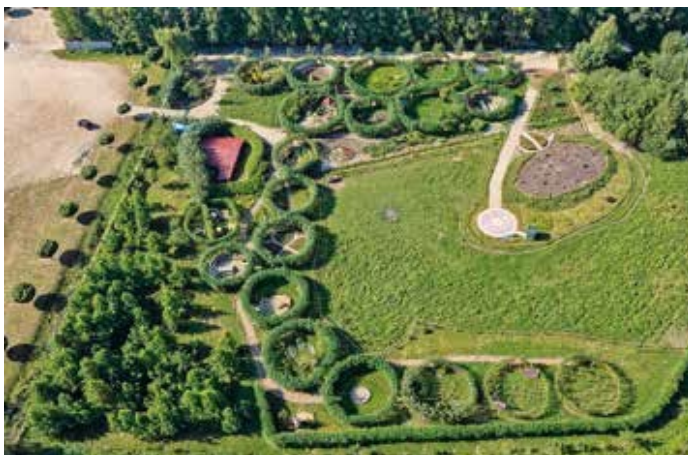
Ryc. 114. Festiwal Ogrodowy – widok z lotu ptaka. Zmiana rozmieszczenia ogrodów pokazowych, 2015