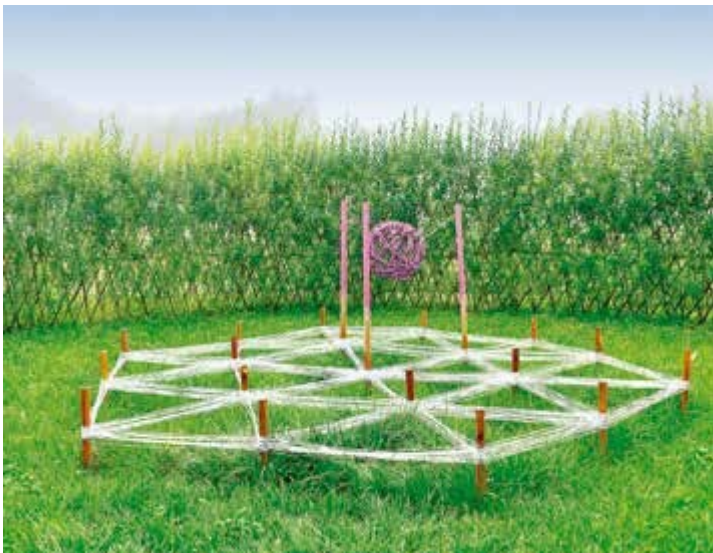
Ryc. 123. Studenci SKN Perspektywa, Uniwersytet Rzeszowski. Ogród Fraktali, 2016