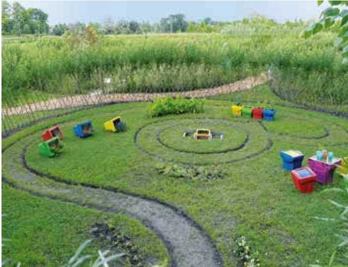
Ryc. 112. Irena Pełczyńska Iprojekt. Ogród – Pop Art czy żart, 2014