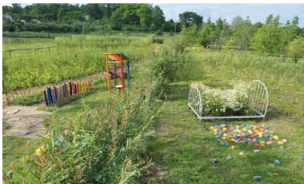
Ryc. 108. Aleksandra Pawlik-Świerz, Elżbieta Piórecka. Domek z ogródkiem, 2013, fot.