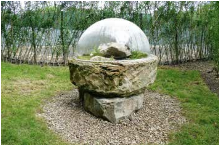
Ryc. 117. Joanna Patrycja Korczak-Wodnicka z zespołem. Litosfera, 2015