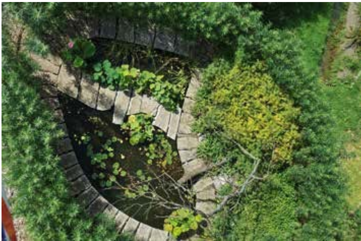
Ryc. 116. Joanna Patrycja Korczak-Wodnicka z zespołem. Hydrosfera, 2015, fot. N.