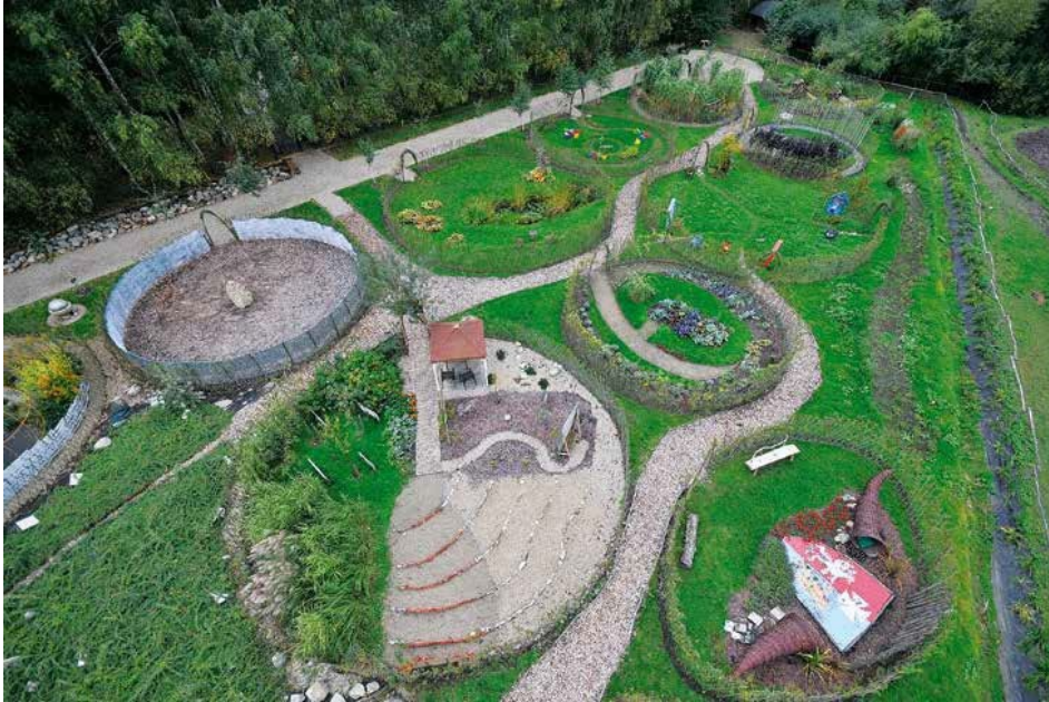
Ryc. 106. Festiwal Ogrodowy – widok z lotu ptaka od strony wschodniej, 2013

Litosfera. Joanna Patrycja Korczak-Wodnicka, Grzegorz Chmielewski, Justyna Wilkowska.