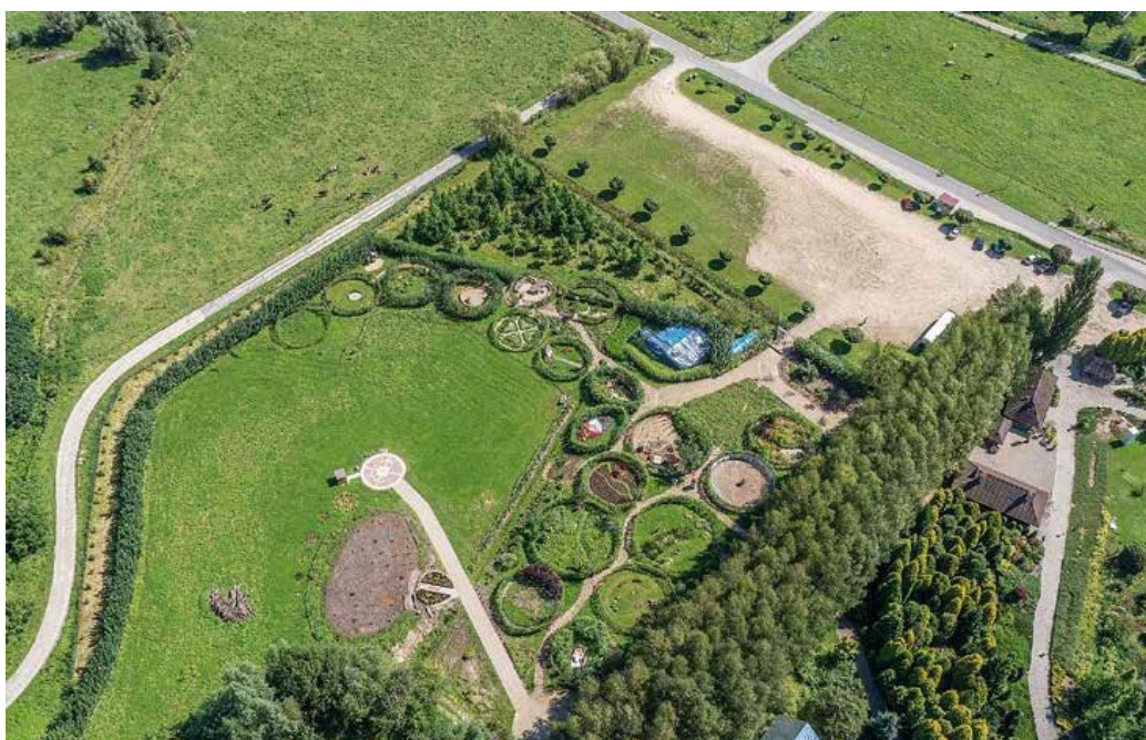
Ryc. 110. Festiwal Ogrodowy – widok z lotu ptaka, 2014