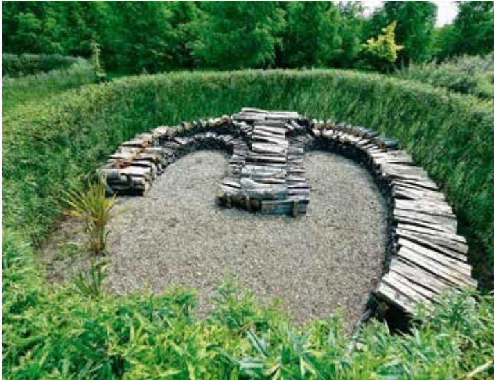
Ryc. 122. Narcyz Piórecki. Blokowisko, 2016