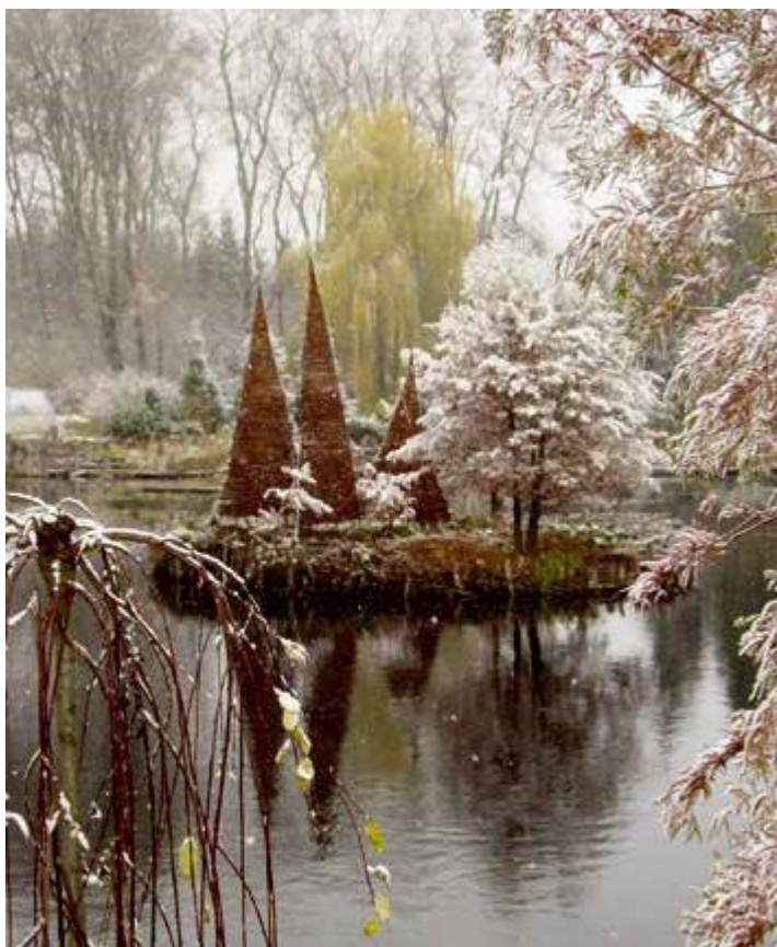
Ryc. 144. Stanisław Dziubak, 2002