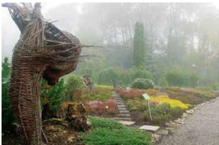
Ryc. 153. Peter Krupa, 2004