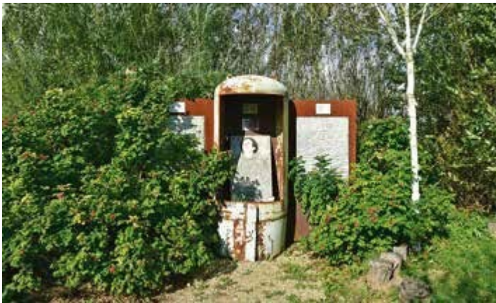
Ryc. 139. Jan Rylke. Kapliczka postindustrialna, 2020