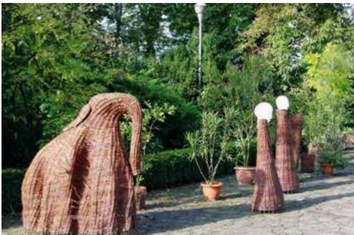
Ryc. 152. Krzysztof Czerwiak, 2004