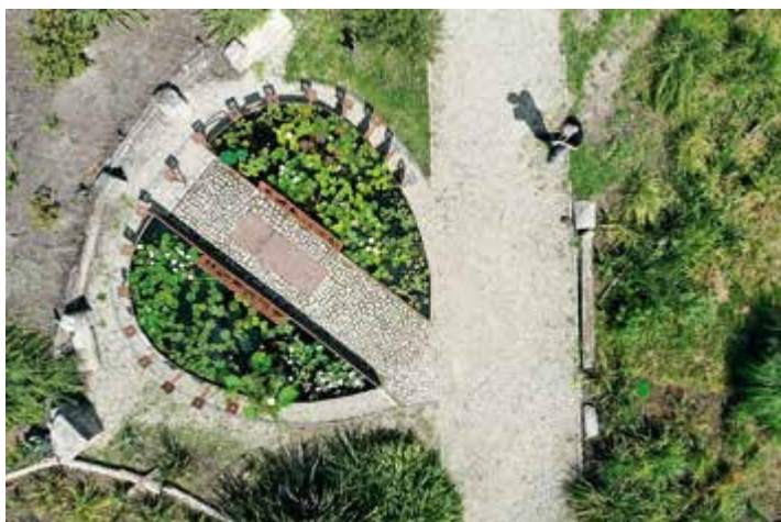
Ryc. 141. Narcyz Piórecki. Miniogrody wodne – widok z lotu ptaka, 2020, fot. T. Ciesielski