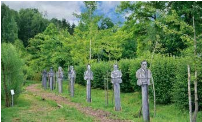
Ryc. 140. Jan Rylke. Panteon zapomnianych kwiatów polskich, 2020