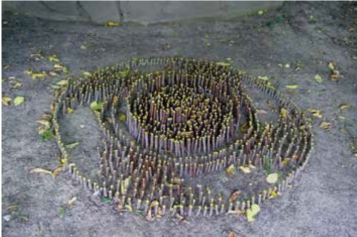
Ryc. 150. Jagoda Krajewska, 2003