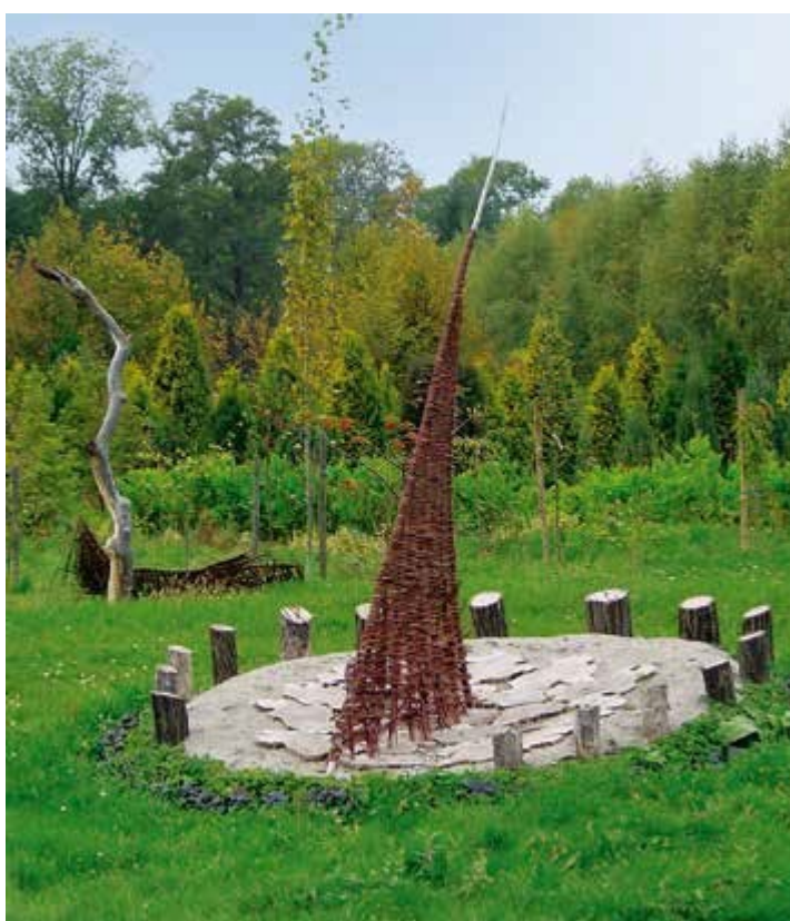
Ryc. 149. Anna Burlikowska, 2003, fot. N. Piórecki