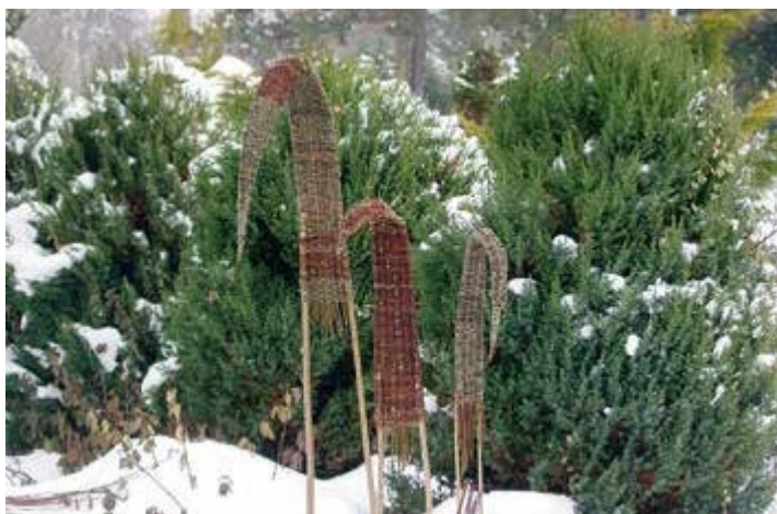
Ryc. 146. Katarzyna Krzykawska, 2002