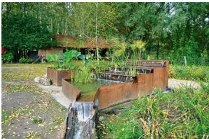
Ryc. 142. Narcyz Piórecki. Miniogrody wodne, 2020