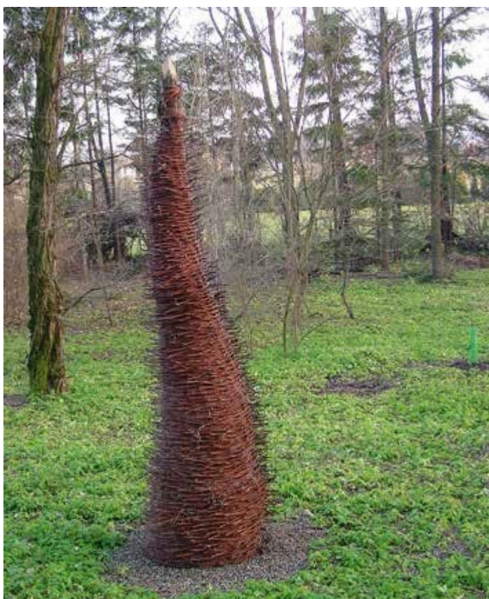
Ryc. 145. Jolanta Kazimierska-Brejdak, 2002