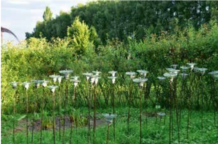
Ryc. 138. Piotr Szwiec. Elektryczna łąka, 2020